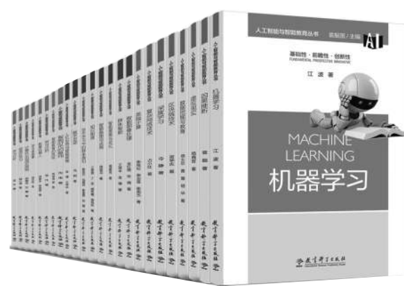
“人工智能与智能教育丛书”