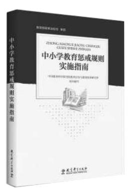
《中小学教育惩戒规则实施指南》