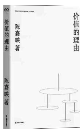
《价值的理由》 陈嘉映著 上海文艺出版社

亚里士多德说，人是逻各斯(logos)的动物，由于“logos”一词的多义性，这句话常被译为“人是语言的动物”或“人是理性的动物”。查尔斯·泰勒在谈论关于“人”的这一定义时评论道，“人是语言的动物”，这最终无疑会包含某种观念，即理性(reason)于人类生活而言是关键性的。这里的“rea-