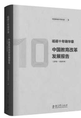
《砥砺十年铸华章:中国教育改革发展报告(2010—2020年)》