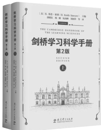
《剑桥学习科学手册(第2版)》