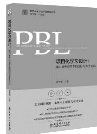
《项目化学习设计:学习素养视角下的国际与本土实践(第2版)》