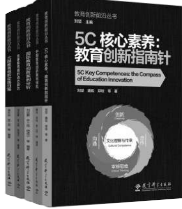
“教育创新前沿丛书”