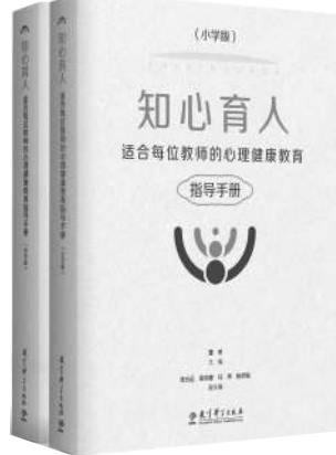
《知心育人——适合每位教师的心理健康教育指导手册(小学版、中学版)》