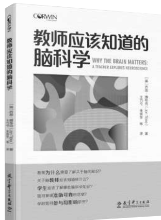
《教师应该知道的脑科学》