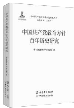
《中国共产党教育方针百年历史研究》