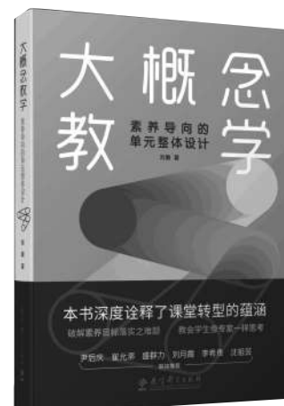
《大概念教学:素养导向的单元整体设计》