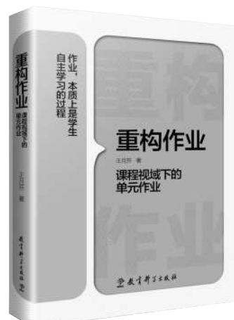
《重构作业——课程视域下的单元作业》