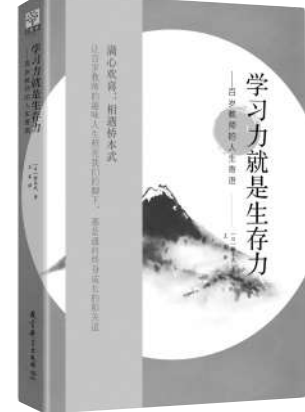
《学习力就是生存力——百岁教师的人生寄语》