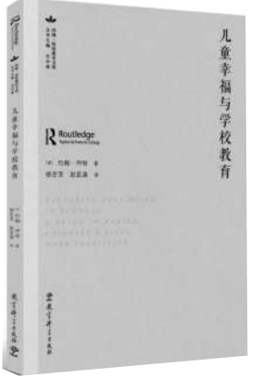
《儿童幸福与学校教育》