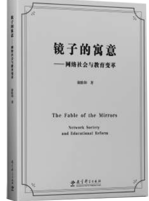
《镜子的寓意——网络社会与教育变革》