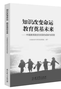
《知识改变命运 教育奠基未来——中国教育脱贫攻坚的成就与经验》