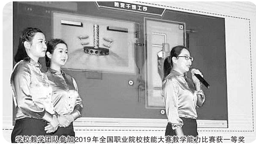
学校教学团队参加2019年全国职业院校技能大赛教学能力比赛获一等奖

实施“强基计划”,打造一支高水平“双师”队伍。首先,强化专业教学能力。关注专业发展前沿,组织教师参加专业提升研修和培训,夯实教师专业理论基础;组建专业研究团队,积极参与教材、精品在线开放课程、专业教学资源库建设等,提升教学研究能力;充分利用信息化手段开展专业教学,提升课堂管理水平和教学效果。近年来,教师参加河南省职业院校技能大赛教师教学能力比赛获得一等奖9项、二等奖6项;参加全国职业院校技能大赛教师教学能力比赛获得一等奖1项、二等奖1项、三等奖6项。其次,强化实践操作能力。开展课程开发与应用、技术技能实训、